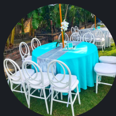
SILLA FLOR DE LIZ